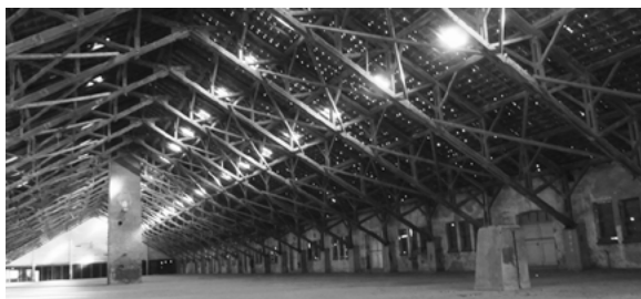
Neuengamme – Fábrica de tijolos (interior)

França, por classes etárias, para o trabalho forçado no Reich por um período até dois anos (a recusa e fuga de jovens do STO alimentaria largamente a guerrilha da Resistência). A idade de recrutamento aumentaria em fevereiro de 1944 para responder a novas exigências alemãs: dos 16 aos 60 anos para homens e dos 18 aos 45 anos para mulheres. O único fator temporário do abrandamento desta mobilização deu-se quando o novo ministro do Armamento alemão, Albert Speer, acordou com o ministro de Vichy, Jean Bichelonne, isentar das requisições Sauckel os operários das indústrias francesas que contribuíssem com, pelo menos, 75% da sua produção para o esforço de guerra alemão.