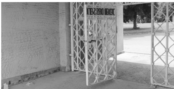
Buchenwald — Portão principal