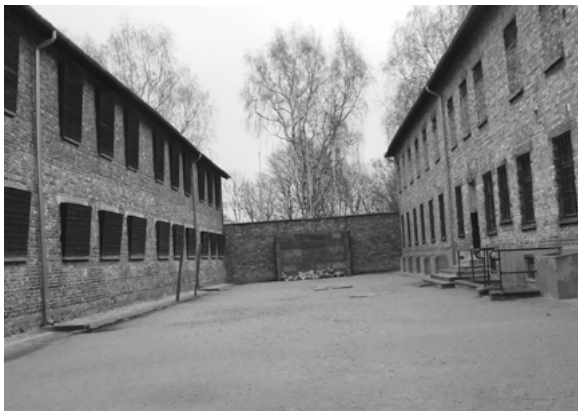
Auschwitz — Muro de fuzilamento

No total, em todo o complexo de Auschwitz, terão morrido mais de 1 milhão de pessoas. É um número esmagador, que fala por si. O campo foi libertado pelo exército soviético em 27 de janeiro de 1945.