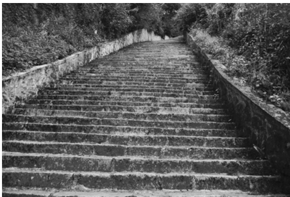
Mauthausen — «Escada da Morte»

Dachau: o campo «modelo» aberto logo em 1933 pelos nazis, perto da cidade de Munique.