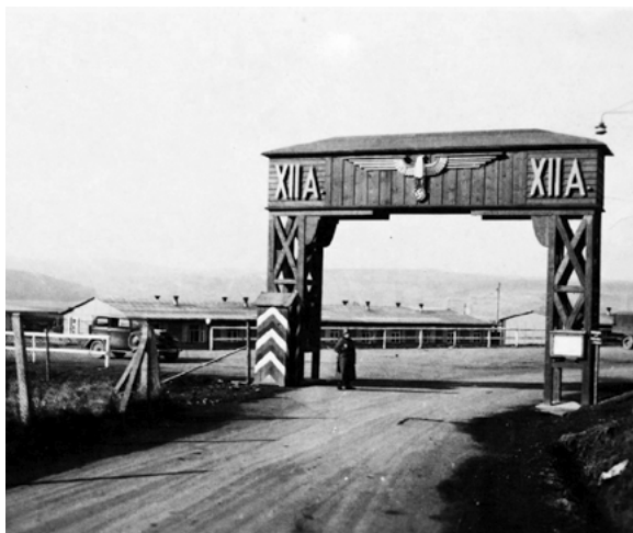
Portal do Stalag XII-A, situado perto de Limburg/Lahn (Alemanha)

A outra vertente do trabalho não voluntário para o esforço de guerra do III Reich foi a dos prisioneiros de guerra que, ao abrigo da Convenção de Genebra de 1929, eram obrigados a trabalhar para a potência inimiga se não fossem oficiais ou se as tarefas que desenvolvessem não estivessem diretamente relacionadas com atividades bélicas.