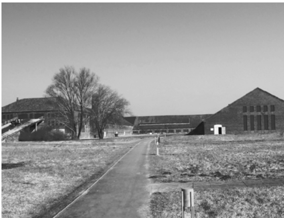
Neuengamme — Fábrica de tijolos

escravo» pelas brigadas Sauckel ou pela Gestapo. Só nos campos da SS, entre fins de 1942 e de 1944, os presos a trabalhar para a indústria de armamento passam de 25 000 para cerca de 420 000. Reclusos dos campos satélites (Mazower, 2013, p. 314) de Dachau e Sachsenhausen trabalham para a BMW e a Heinkel respetivamente, de Neuengamme para as baterias de submarinos da AFA, e 60 000 escavam, em Mittelbau, os tuneis onde se fabricam as V2. Outros campos satélites dedicam-se à reparação dos danos de guerra, à remoção de escombros e à reconstrução.