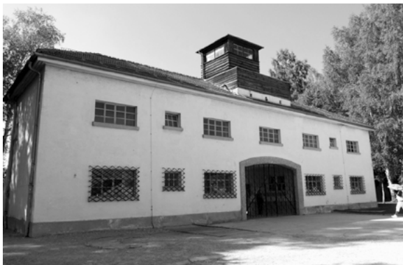
Dachau — Portão principal

outros grupos começaram igualmente a ser internados: Testemunhas de Jeová, membros da igreja católica, ciganos, intelectuais, homossexuais, autores de crimes civis e outros «antissociais», além dos judeus que chegaram em elevado número na sequência das prisões encetadas aquando do pogrom de novembro, vulgarmente designado de Noite de Cristal. Quando a guerra começou, o campo tinha 4000 prisioneiros. Este foi o campo modelo na fase inicial do processo concentracionário, dentro e fora da Alemanha, e o que funcionou durante mais tempo: entre 22 de março de 1933, data da chegada do primeiro grupo de cerca de uma centena de comunistas de Munique, acompanhados de 54 guardas, e a data da sua libertação pelos Aliados, a 29 de abril de 1945. Os soldados da 42. a e da 45. a Divisão de Infantaria do 7. o Exército dos EUA encontraram cerca de 32 000 internados oriundos de 30 países europeus. Por razões de subnutrição e de doenças, muitos ainda morreram depois da libertação.