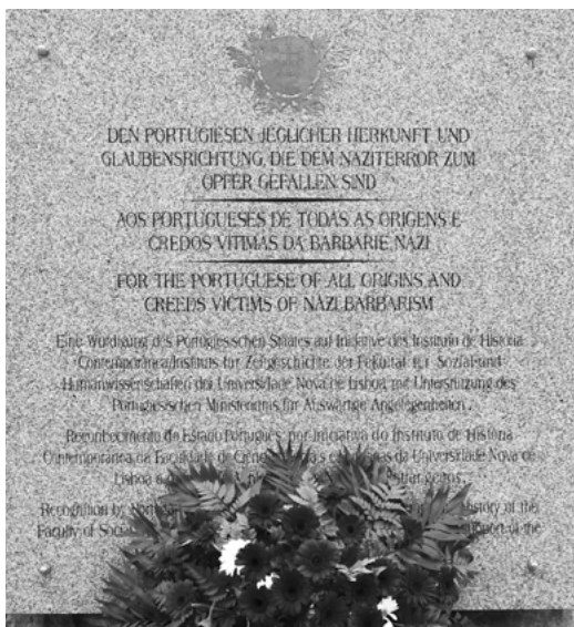
Placa descerrada em 2017 no «Muro das Lamentações» do campo de concentração de Mauthausen, em homenagem a todos os portugueses vítimas da barbárie nazi

todos os campos de concentração ou similares, foram «vítimas da barbárie nazi». A partir desse ano, o Estado português (e o IHC, como unidade de investigação ligada à iniciativa) passaram a estar presentes, e o nosso país representado oficialmente nas impressionantes cerimónias anuais de libertação do campo. Em maio de 2019, foi mesmo possível integrar na delegação oficial portuguesa duas turmas de estudantes do ensino secundário do concelho de Loulé (graças ao apoio da Câmara Municipal), inaugurando a participação (previamente preparada) dos nossos jovens estudantes e das