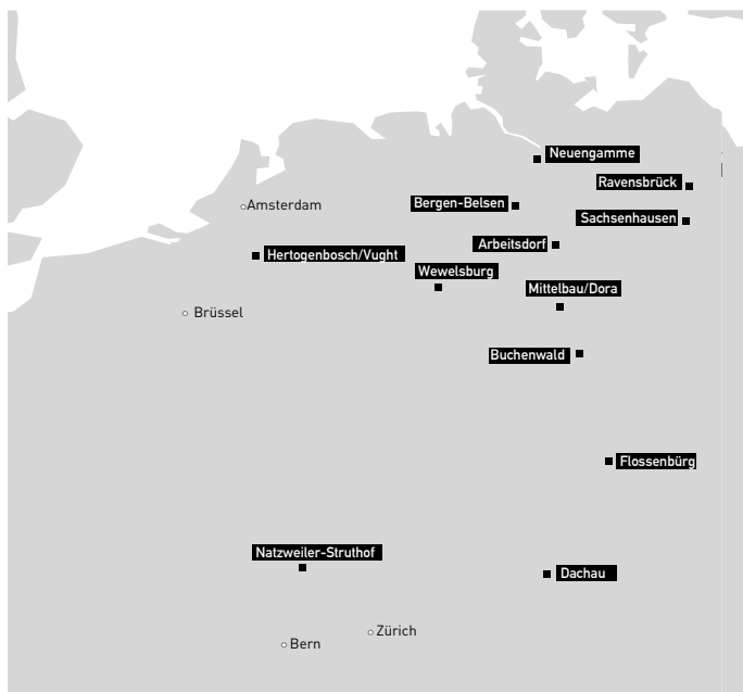
Mapa com a localização dos principais campos de concentração do III Reich (DISTEL, 2005. Adaptação de Gonçalo Castilho)

tropas de Mussolini colapsavam face à resistência do exército e do povo grego, reforçada pelo envio de tropas britânicas. Deriva balcânica que obrigou o comando alemão a adiar para junho de 1941 a gigantesca ofensiva contra a URSS, o arqui-inimigo judaico-bolchevista. Mas a aventura militar do III Reich abriu ainda uma nova frente fora da Europa, no Norte de África, onde, desde 1941, a tropa alemã acorrera para salvar as tropas italianas do desastre face aos britânicos e entrara em força com o Afrika Korps do general Rommel, em 1942.