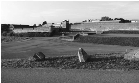
Mauthausen — Vista geral