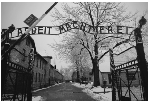
Auschwitz — Portão de entrada

O portão principal do campo, ícone do terror nazi, vulgarmente conhecido como a «Porta da Morte», ostenta a inscrição: « Arbeit macht frei » («Trabalho Liberta»). O campo tinha um perímetro de