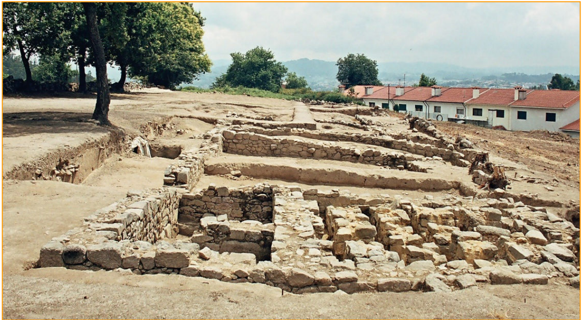
Estação arqueológica de Perrelos, Delães, Vila Nova de Famalicão

Em http://arqueologia.vilanovadefamalicão.org/visita-virtual/visita-virtual_perrelos5.htm tens acesso a uma visita virtual que te permite ver um pouco do que existe na estação.