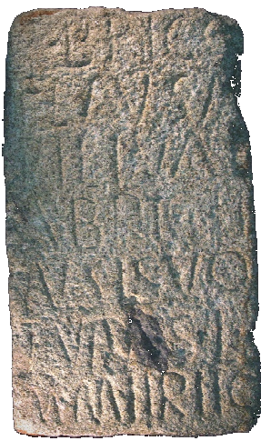
ARA (Encontrada em S. Miguel-O-Anjo)