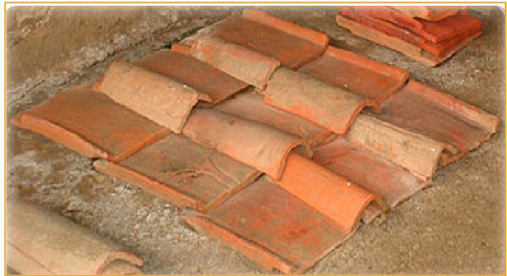
Telhas romanas (tégula e imbrex)

Nos finais do séc. IV / inícios do séc. V, o edifício foi reestruturado, passando a ter uma funcionalidade diferente. Pertence a esta fase de ocupação a maior parte da informação disponível